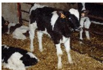
Bovin lait : 55 vaches laitières Prim' Holstein 450 000 l de quota laitier et vente directe

Une exploitation diversifiée avec 4 ateliers de productions animales