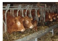
Bovin allaitant : 40 vaches limousines Système naisseur - reproducteurs